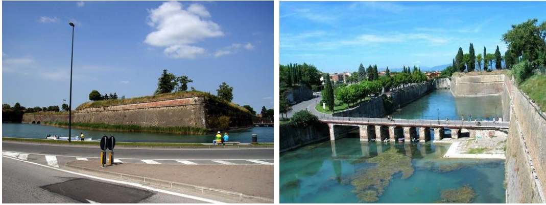
Peschiera egyik bástyája illetve a vízzel feltöltött árok és várfal.

Az 1830-as években Radetzky tábornok, az itáliai osztrák haderők főparancsnoka a Tiroloba vezető utak védelmére az Adige folyó mentén újabb erődök építését rendelte el (Werk Sofia, Werk San Leonardo, Forte San Procolo).